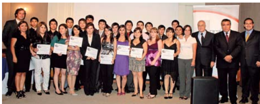
La graduación del grupo de jóvenes que participó en el Programa Aprendices 2010 se realizó el 3 de marzo de 2011.