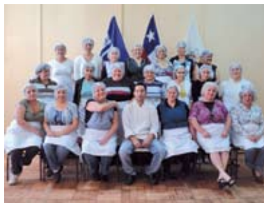
Estudiantes del CEC.